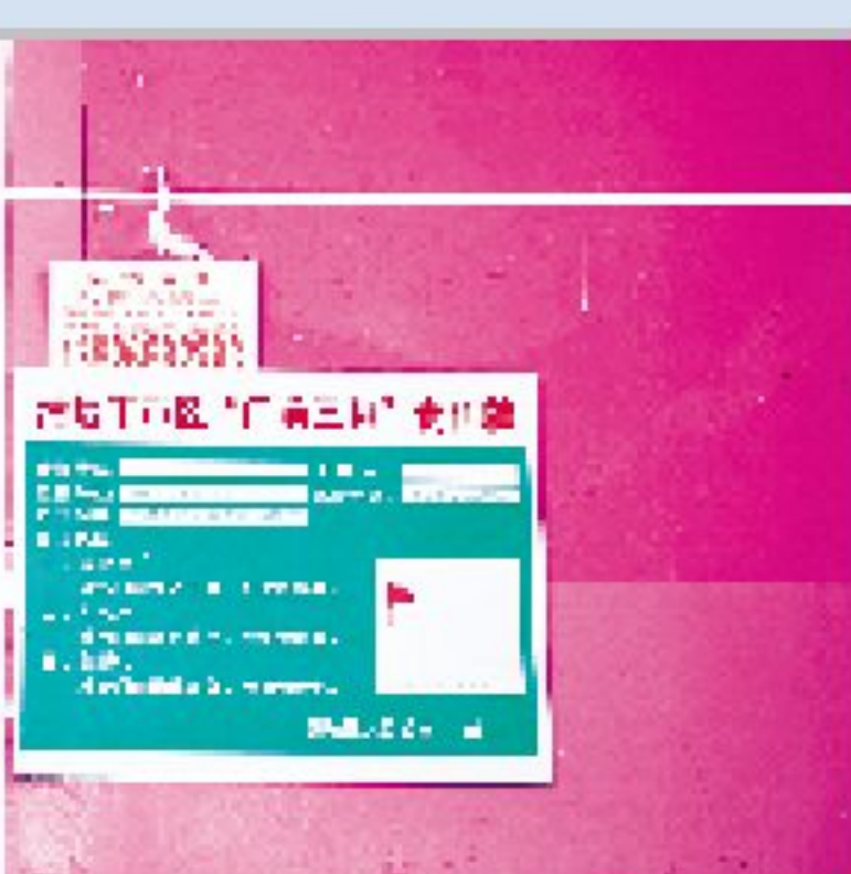
←7月4日,小广告卡片插在城南市场周边一商铺的墙上。