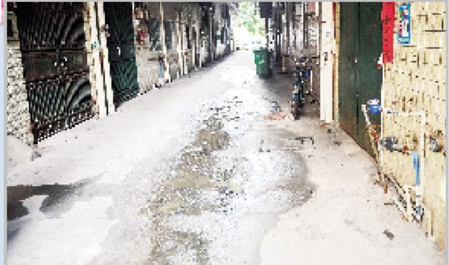
←7月4日,城南市场周边一住宅的内街背巷大面积积水。