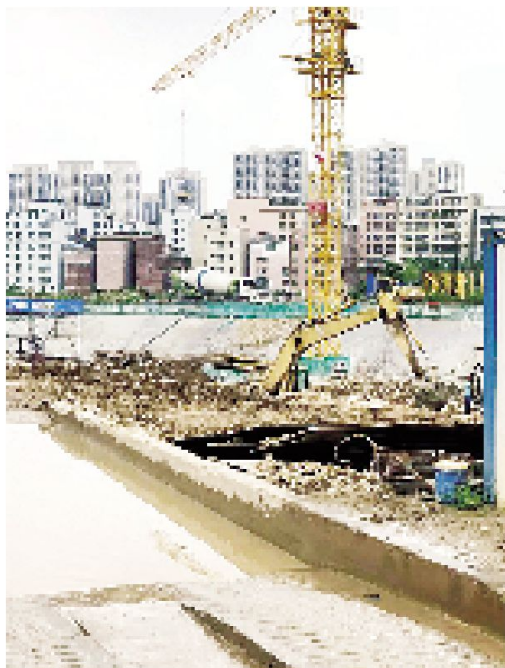
时代倾城二期工地施工机械冒黑烟。