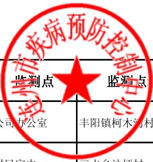
连州市用户水龙头水质监测信息公开表（2020年第二季度6月份乡镇）